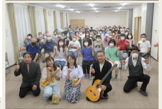
▶ 観客とメンバーと一緒にポーズ